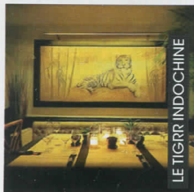
LE TIGRR INDOCHINE

L'Ermitage, le plus ancien hôtel de la station (villa privée du XIX e siècle) s'enri-